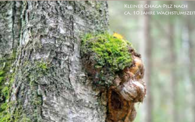
KLEINER CHAGA-PILZ NACH CA. 10 JAHRE WACHSTUMSZEIT