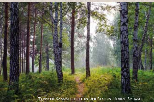
TYPISCHE SAMMELSTELLE IN DER REGION NÖRDL. BAIKALSEE

DER WILD WACHSENDE CHAGA PILZ HAT NICHT NUR DIE HÖCHSTEN ANTI-OXIDATIONSWERTE IM VERGLEICH ZU ALLEN ANDEREN PILZEN, SONDERN AUCH IM VERGLEICH ZU JEDEM UNS BEKANNTEN LEBENSMITTEL (GETESTET VON DER USDA, U.S. DEPARTMENT OF AGRICULTURE UND TUFTS UNIVERSITY IN BOSTON, MA).