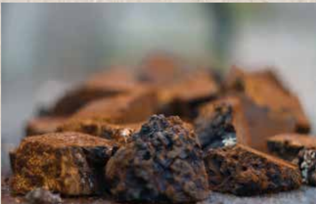
CHAGA STÜCKE VOR DEM ERSTEN MAHLPROZESS

MUMIJO IST EIN DUNKELBRAUNER TEER AUS ÜBER HUNDERTTAUSENDEN JAHREN FOSSILISIERTEN HONIGWABEN VON WILDEN BIENEN. ER IST ÄUSSERST SELTEN UND NUR IN HÖHLEN IN SEHR HOHEN BERGREGIONEN IN ZENTRALASIEN ZU FINDEN. UNSER MUMIJO WIRD VON HAND UNTER HÖCHSTEN ANSTRENGUNGEN IN REGIONEN OBERHALB VON 2.500 M IM SIBIRISCHEN ALTAI GEBIRGE GESAMMELT. IN DER VOLKSMEIZIN WURDE ER „DAS GESCHENK DER GÖTTER“ GENANNT UND SEIT VIELEN TAUSEND JAHREN WIRD ER ALS SUPER-BOOSTER FÜR DAS IMMUNSYSTEM VERABREICHT; SCHAMANEN UND MEDIZINER AUS ZENTRALASIEN NENNEN IHN DESHALB AUCH „DER STÄRKSTE, DEM MENSCHEN BEKANNTEN IMMUN-BOOSTER“.