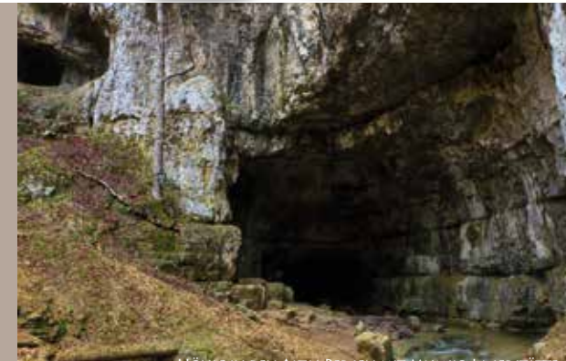
HÖHLE IN DEN ALTAI-BERGEN MIT MUMIJO-LAGERSTÄTTE