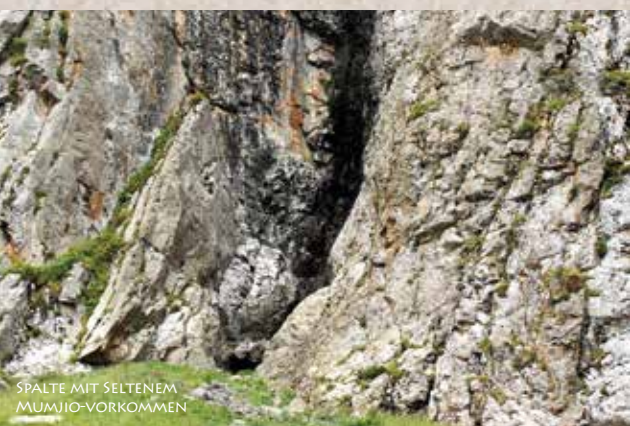
SPALTE MIT SELTENEM MUMIJO-VORKOMMEN

WENN MAN DEN BIRKENPILZ SIEHT, GLEICHT ER EINEM GROSSEN MUTTERMAL ODER EINEM MELANOM. IN DER SIGNATURENLEHRE SAGT MAN, DASS NAHRUNGSMITTEL, DIE ÄUSSERE ÄHNLICHKEITEN MIT EINEM KÖRPERTEIL AUFWEISEN, EINE HEILWIRKUNG AUF DIESEN BEREICH DES KÖRPERS HABEN. SO ETWA HABEN WALNÜSSE ERSTAUNLICHE ÄHNLICHKEITEN MIT DEM GEHIRN. IN WALNÜSSEN FINDEN SICH SEHR HOHE OMEGA-3 WERTE, DIE FÜR DIE HIRNFUNKTION UND GESUNDHEIT DES GEHIRNS WICHTIG SIND.