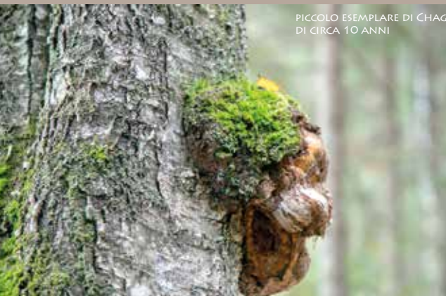
PICCOLO ESEMPLARE DI CHAGA DI CIRCA 10 ANNI

CHAGA SUPER-MULTI-EXTRACT JAR 30 SERVINGS, JAR & BAG 60 SERVINGS, BAG 90 SERVINGS