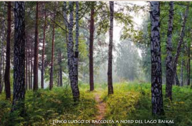
TIPICO LUOGO DI RACCOLTA A NORD DEL LAGO BAIKAL

IL FUNGO PROVENIENTE DAI LUOGHI PIÙ SELVAGGI PRESENTA ALTE CONCENTRAZIONI DI ANTIOSSIDANTI NON SOLO RISPETTO AD ALTRI FUNGHI MA ANCHE IN RAFFRONTO AD ALTRI ALIMENTI (TESTATO DALLO USDA, U.S. DEPARTMENT OF AGRICULTURE AND TUFTS UNIVERSITY IN BOSTON, MA).