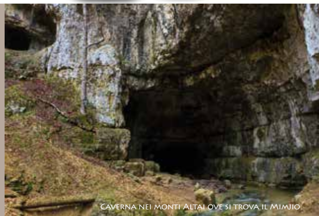
CAVERNA NEI MONTI ALTAI OVE SI TROVA IL MUMIJO

1) QUESTO È UN ESTRATTO INFORMATIVO DELLE PUBBLICAZIONI DELL'AUTORE B. O'CONNOR E RAPPRESENTA SEMPLICEMENTE L'USO STORICO-CULTURALE DI CHAGA. QUESTE DICHIARAZIONI NON SONO STATE VALUTATE DALLE AUTORITÀ SANITARIE ITALIANE O/E UE, DALLA FDA STATUNITENSE O ALTRE. QUESTO PRODOTTO NON È DESTINATO A TRATTARE, CURARE O PREVENIRE ALCUNA MALATTIA. SE LO DESIDERI, SI PREGA DI CONSULTARE UN MEDICO. IN QUESTO E NEL CONTESTO DELL'ATTUALE LEGISLAZIONE FARMACEUTICA, SEGNALIAMO CHE NON Affermiamo CHE IL NOSTRO INTEGRATORE ALIMENTARE SIA IN GRADO DI MIGLIORARE O CURARE LE MALATTIE INDICATE!