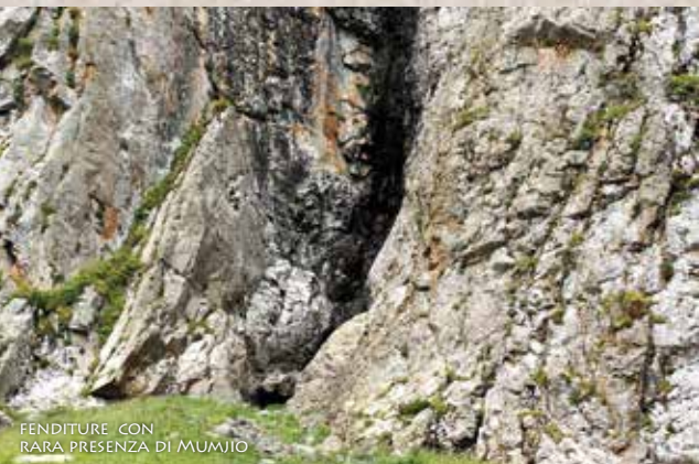
FENDITURE CON RARA PRESENZA DI MUMIJO

MUMIJO È UN CATRAME DI COLORE MARRONE SCURO DERIVANTE DAL FAVO DI API SELVATICHE FOSSILIZZATOSI CENTINAIA DI MIGLIAIA DI ANNI PRIMA. È ESTREMAMENTE RARO E SI TROVA SOLO NELLE CAVERNE DELLE REGIONI MONTUOSE DELL'ASIA CENTRALE. IL NOSTRO MUMIJO VIENE RACCOLTO MANUALMENTE CON GRANDISSIME DIFFICOLTÀ ED ESTENUANTI FATICHE NELLA REGIONE SIBERIANA DEI MONTI ALTAI AD UNA QUOTA SUPERIORE AI 2500 METRI. NELLA MEDICINA POPOLARE VENIVA DEFINITO " IL REGALO DEGLI DEI " E SOMMINISTRATO COME UNA DROGA EFFICACE PER IL SISTEMA IMMUNITARIO.