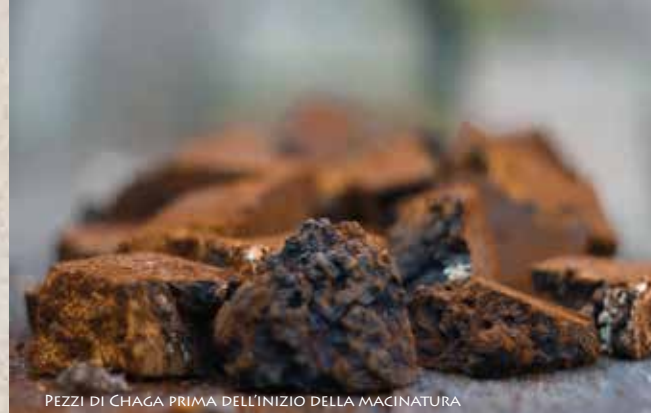
PEZZI DI CHAGA PRIMA DELL'INIZIO DELLA MACINATURA