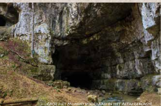
GROT MET MUMIJO VOORRAAD IN HET ALTAI-GEBERGTE

IN TEGENSTELLING TOT ONBEWERKTE CHAGA, HEEFT BEARMEDICINE'S® INSTANT OPLOSBAAR MULTI-SUPER-EXTRACT DEZE BIOLOGISCHE STOFFEN GEACTIVEERD EN IS DAARDOOR VERTEERBAAR DOOR ONS LICHAAM. ONBEWERKTE CHAGA (ALLEEN GEMALEN CHAGA POEDER KAN NIET WORDEN VERTEERD WAARDOOR DE GEZONDHEID ONDERSTEUNENDE STOFFEN ONS LICHAAM Zouden VERLATEN. DE „ACTIVERING“ KAN ALLEEN WORDEN GEDAAN DOOR HET EXTRACTIEPROCES. WANNEER JE EEN CHAGA-THEE BROUWT, DOE JE IETS SOORTGELIJKS ALS EEN MINI-EXTRACTIE, MAAR KRIJG JE SLECHTS <20% VAN DE BELANGRIJKE COMPONENTEN! BOVENDIEN MAAKT HET EXTRACTIEPROCES HET MOGELIJK OM ONBRUIKBARE STOFFEN TE VERWIJDEREN EN HET MAXIMALE AANTAL GEZONDHEIDSONDERSTEUNENDE BIOLOGISCHE STOFFEN TE CONCENTREREN. OM 1 KG CHAGA-EXTRACT TE KRIJGEN, GEBRUIKEN WE ONGEVEER 8 KG ONBEWERKTE CHAGA-PADDENSTOEL.