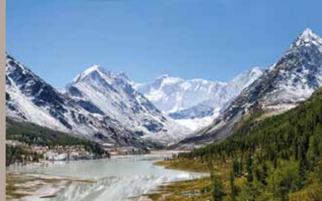
BELUKHA ALTAI MOUNTAINS

1) DIT IS EEN INFORMATIEF FRAGMENT VAN DE PUBLICATIES VAN DE AMERIKANSE AUTEUR BESS O'CONNOR EN VERTEGENWOORDIGT SLECHTS HET CULTUURHISTORISCHE GEBRUIK VAN DE CHAGA-PADDENSTOEL. IN DEZE EN IN DE CONTEXT VAN DE HUIDIGE FARMACEUTISCHE WETGEVING, WIJZEN WE EROP DAT WE NIET Zouden BEWEREN DAT ONS VOEDINGSSUPPLEMENT VERBAND HOUDT MET HET VERBETEREN OF GENEZEN VAN DE AANGEGEVEN ZIEKTEN! VRAAG ZO NODIG EEN ARTS OF ZORGVERLENER OF HET PRODUCT VOOR U GESCHIKT IS.