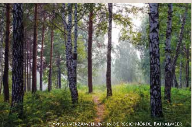
TYPISCH VERZAMELPUNT IN DE REGIO NÖRDL. BAIKALMEER

CHAGA: „DE GENEZER EN KONING VAN ALLE KRUIDEN.“