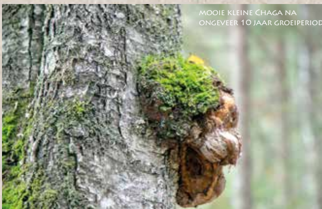
MOOIE KLEINE CHAGA NA ONGEVEER 10 JAAR GROEIPERIODE

DE WERELDHANDELSORGANISATIE (WTO) HEEFT CHAGA ZELFS GECLASSIFICEERD ALS EEN MEDICINALE PADDESTOEL VOLGENS WTO-CODES.