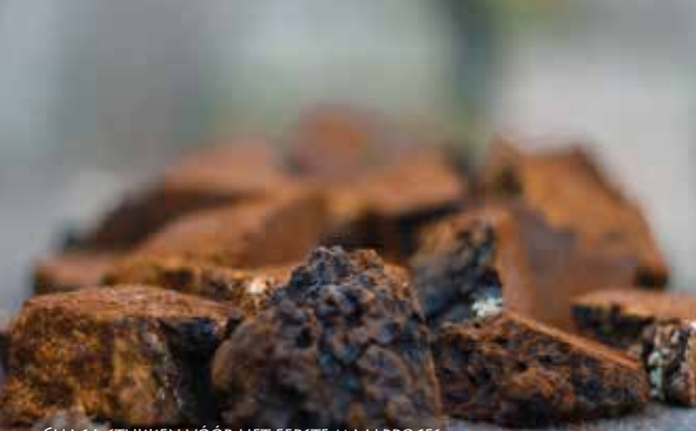
CHAGA-STUKKEN VÓOR HET EERSTE MAALPROCES

CHAGA SUPER-MULTI-EXTRACT JAR 30 SERVINGS, JAR & BAG 60 SERVINGS, BAG 90 SERVINGS